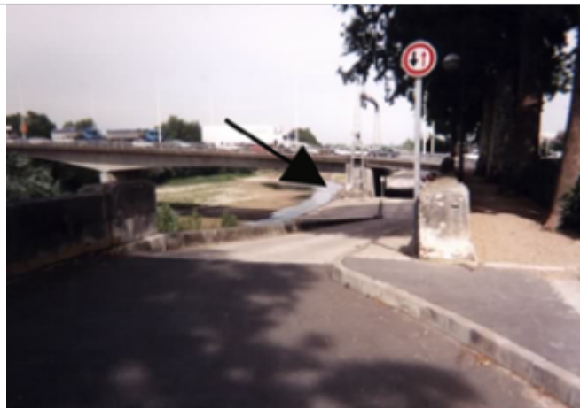
Vue du site BDHE 220 point de repère 281