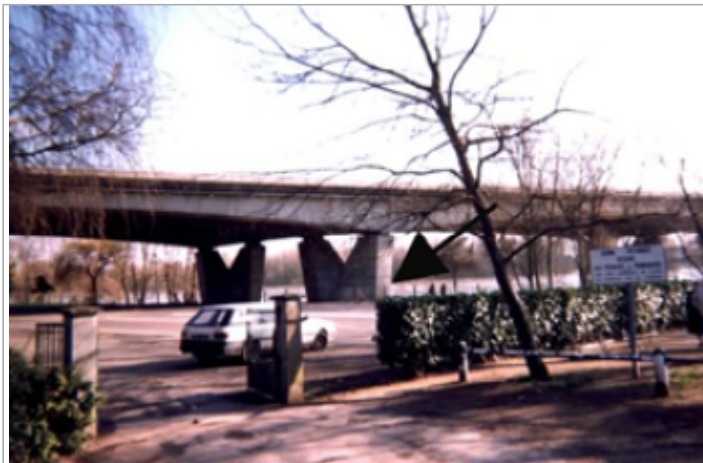
Vue du site BDHE 219 point de repère 280