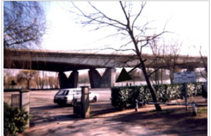
Vue du site BDHE 219 point de repère 280

Coordonnées WGS84 : X: 0.71148435 / Y: 47.40136970