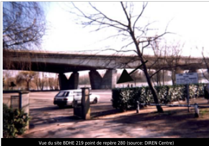
Vue du site BDHE 219 point de repère 280