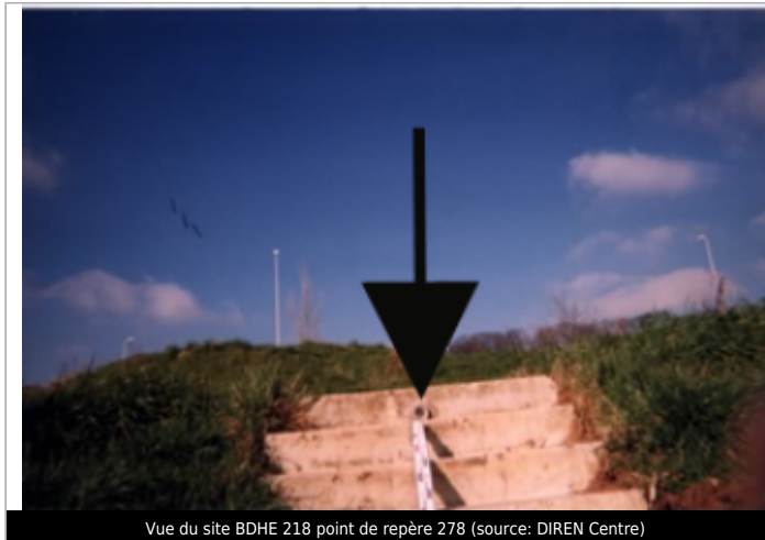
Vue du site BDHE 218 point de repère 278