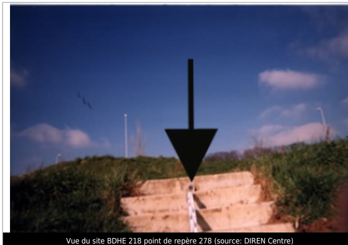
Vue du site BDHE 218 point de repère 278 (source: DIREN Centre)