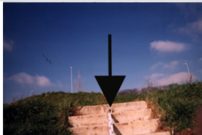
Vue du site BDHE 218 point de repère 278

Coordonnées WGS84 : X: 0.72228037 / Y: 47.40264430