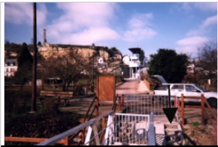
Vue du site BDHE 217 point de repère 277