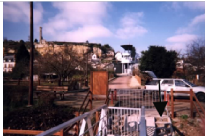
Vue du site BDHE 217 point de repère 277