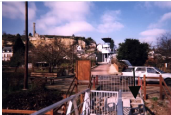
Vue du site BDHE 217 point de repère 277

Coordonnées WGS84 : X: 0.75700991 / Y: 47.40764220