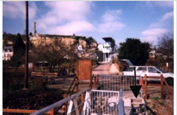
Vue du site BDHE 217 point de repère 277

Coordonnées WGS84 : X: 0.75700991 / Y: 47.40764220