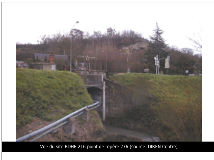
Vue du site BDHE 216 point de repère 276

Coordonnées WGS84 : X: 0.75959660 / Y: 47.40796220