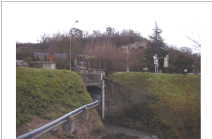
Vue du site BDHE 216 point de repère 276