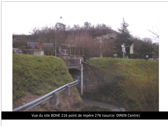
Vue du site BDHE 216 point de repère 276

Coordonnées WGS84 : X: 0.75959660 / Y: 47.40796220