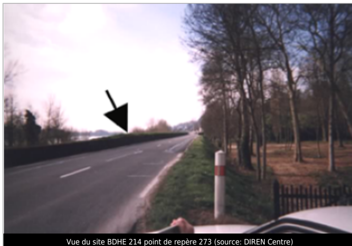
Vue du site BDHE 214 point de repère 273