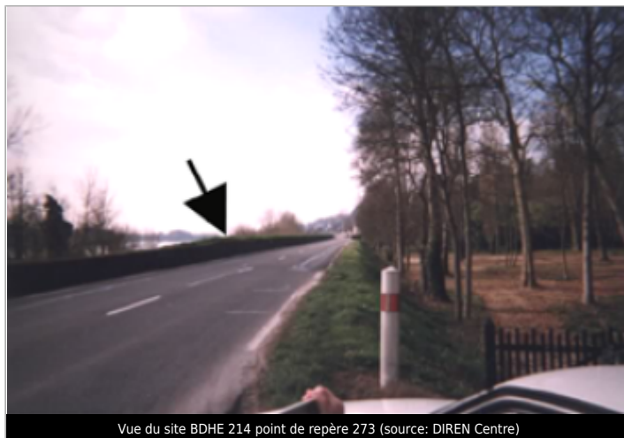
Vue du site BDHE 214 point de repère 273