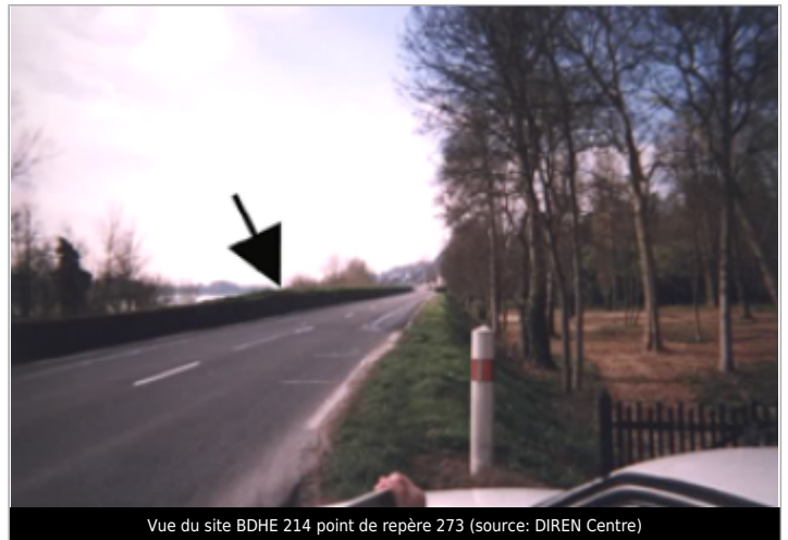
Vue du site BDHE 214 point de repère 273

Coordonnées WGS84 : X: 0.78454213 / Y: 47.41006110