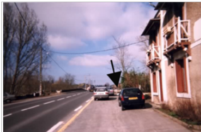
Vue du site BDHE 213 point de repère 272