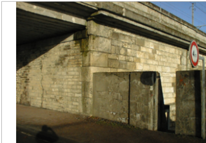
Vue du site BDHE 212 point de repère 271