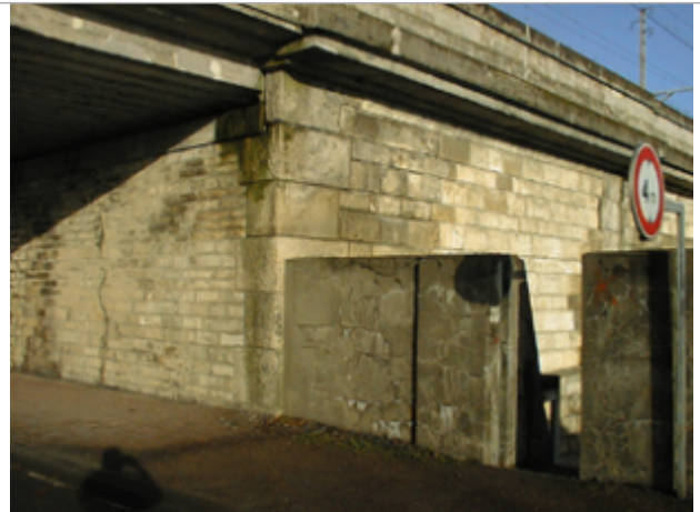
Vue du site BDHE 212 point de repère 271