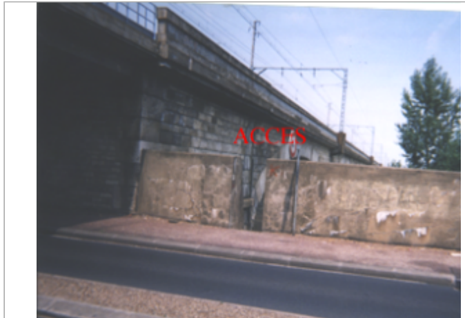
Vue du site BDHE 211 point de repère 270