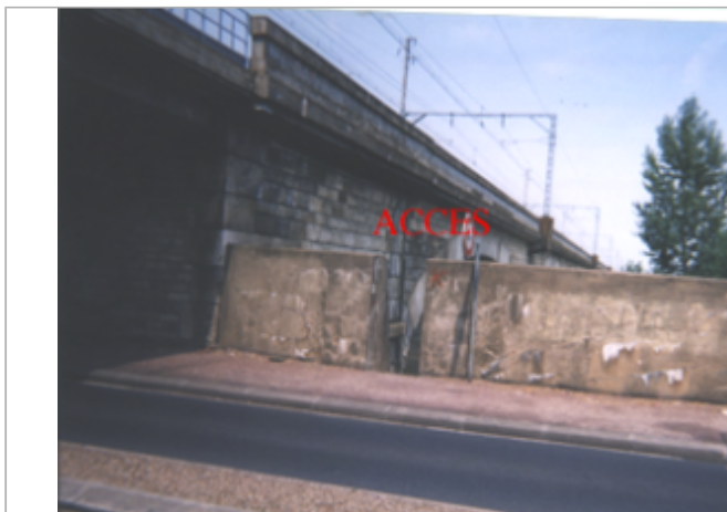
Vue du site BDHE 211 point de repère 270