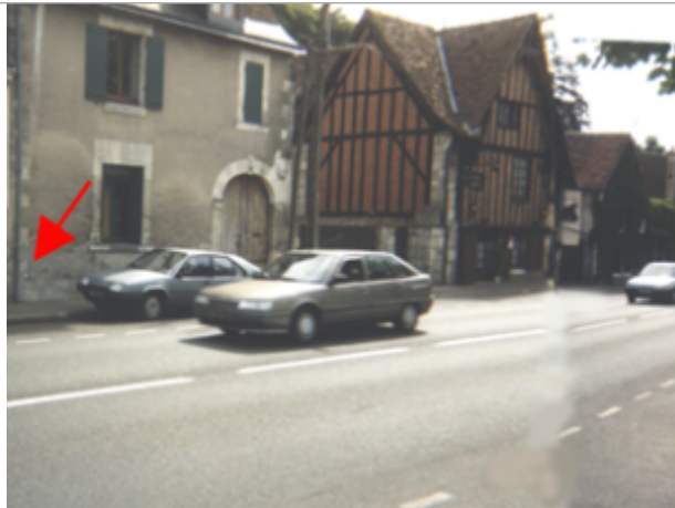
Vue du site BDHE 210 point de repère 269