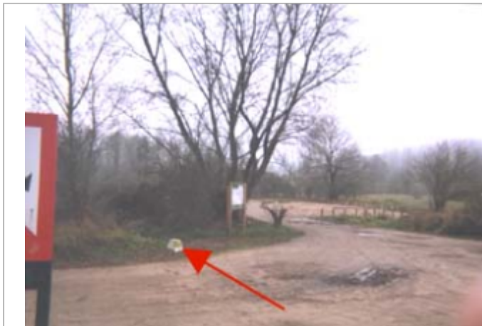
Vue du site BDHE 209 point de repère 390

Coordonnées WGS84 : X: 0.86416793 / Y: 47.39632290