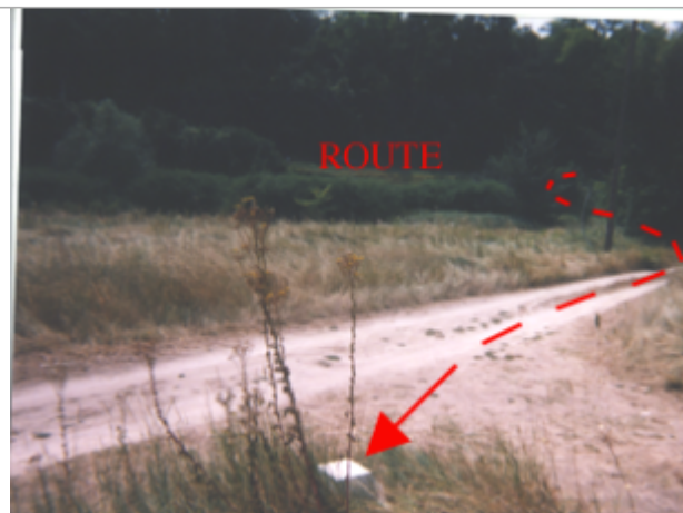
Vue du site BDHE 207 point de repère 267