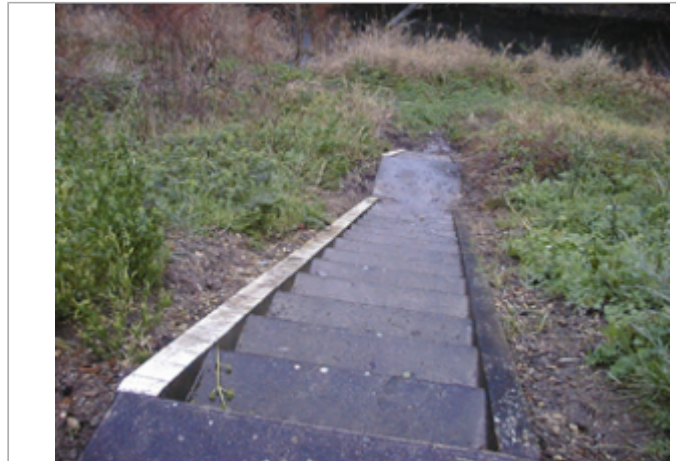
Vue du site BDHE 206 point de repère 266