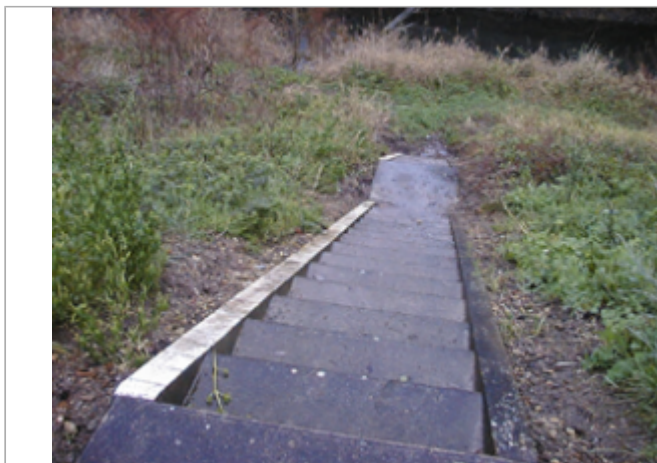
Vue du site BDHE 206 point de repère 266