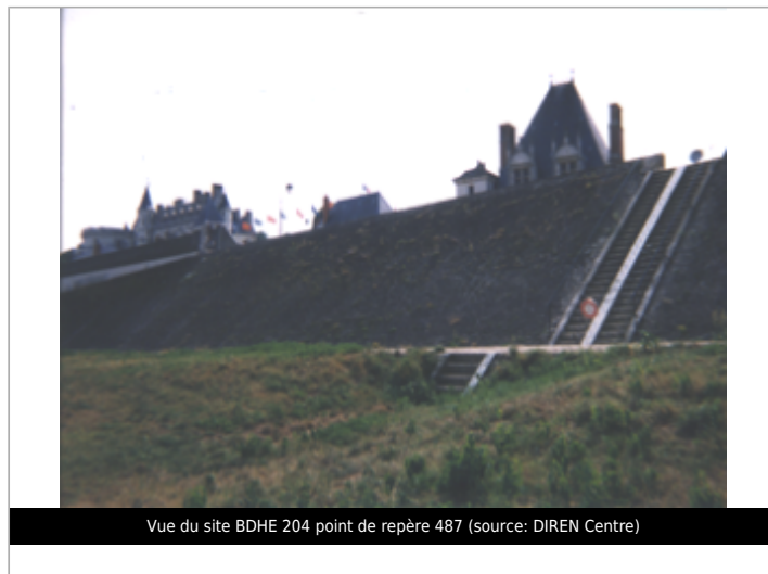
Vue du site BDHE 204 point de repère 487