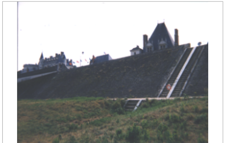
Vue du site BDHE 204 point de repère 487