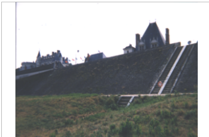
Vue du site BDHE 204 point de repère 487