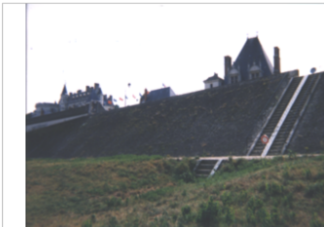
Vue du site BDHE 204 point de repère 487

Coordonnées WGS84 : X: 0.98347223 / Y: 47.41363560