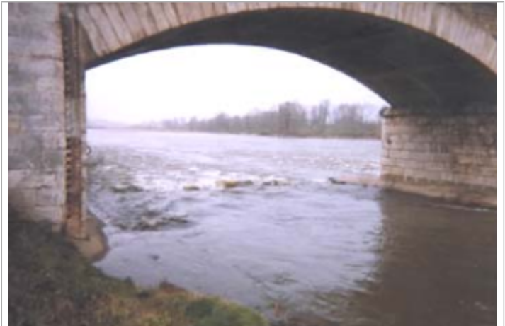
Vue du site BDHE 203 point de repère 264

Coordonnées WGS84 : X: 0.98278316 / Y: 47.41608200