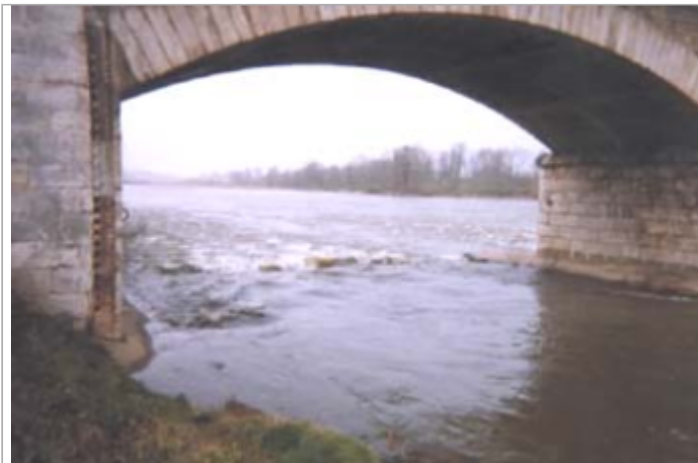
Vue du site BDHE 203 point de repère 264

Coordonnées WGS84 : X: 0.98278316 / Y: 47.41608200