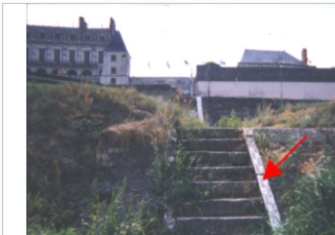
Vue du site BDHE 202 point de repère 262 (source: DIREN Centre)

Coordonnées WGS84 : X: 0.98454546 / Y: 47.41402340