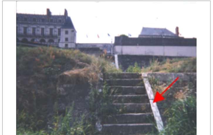
Vue du site BDHE 202 point de repère 262

Coordonnées WGS84 : X: 0.98454546 / Y: 47.41402340