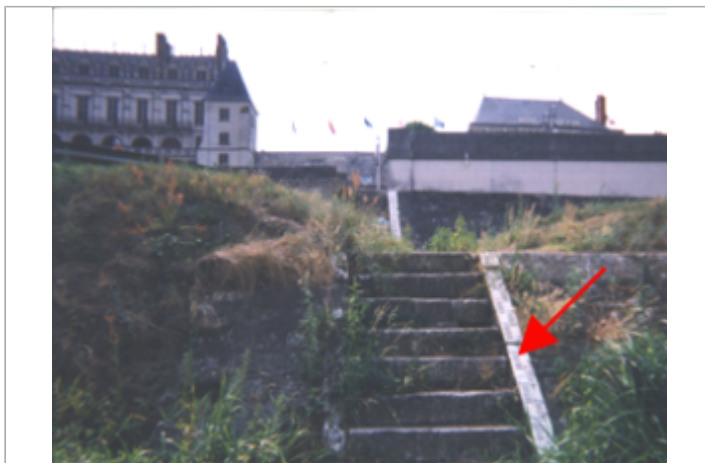
Vue du site BDHE 202 point de repère 262