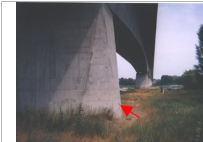
Vue du site BDHE 201 point de repère 261