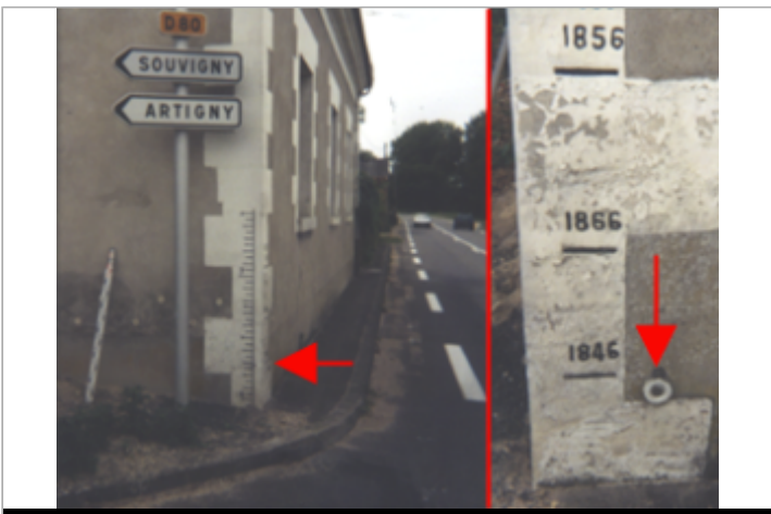
Vue du site BDHE 200 point de repère 258

GÉOLOCALISATION Coordonnées WGS84 : X: 1.05080477 / Y: 47.44259890 Coordonnées RGF93 (Lambert 93) X: 553116 / Y: 6706507 Coordonnées RGF93 (ETRS89) : X: 1.0508048 / Y: 47.4425989 Code Hydro: ----0000 Rive de référence: Gauche