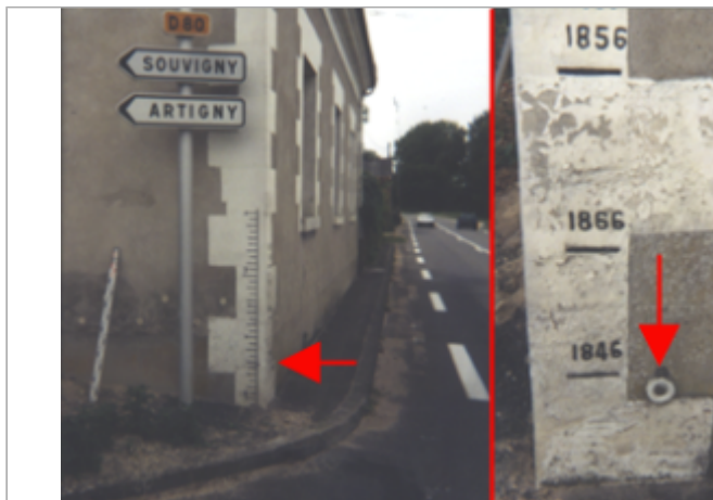
Vue du site BDHE 200 point de repère 258

Coordonnées WGS84 : X: 1.05080477 / Y: 47.44259890