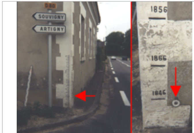
Vue du site BDHE 200 point de repère 258

Coordonnées WGS84 : X: 1.05080477 / Y: 47.44259890