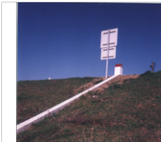
Vue du site BDHE 199 point de repère 257

Coordonnées WGS84 : X: 1.05490744 / Y: 47.44731390