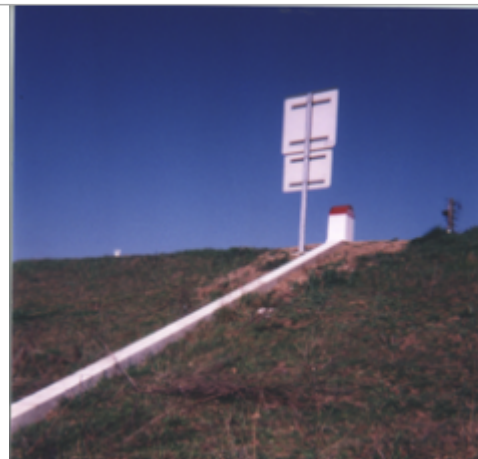
Vue du site BDHE 199 point de repère 257