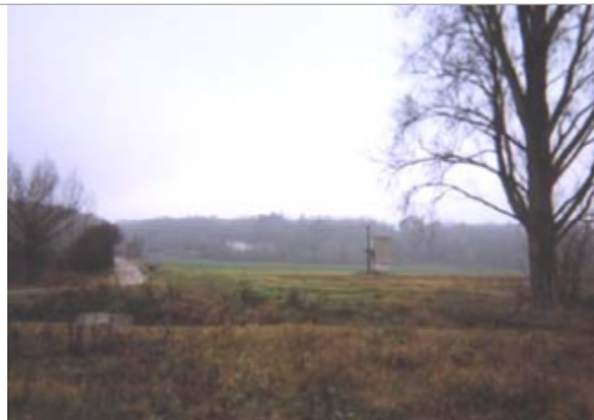
Vue du site BDHE 197 point de repère 255

Coordonnées WGS84 : X: 1.07674419 / Y: 47.45431310