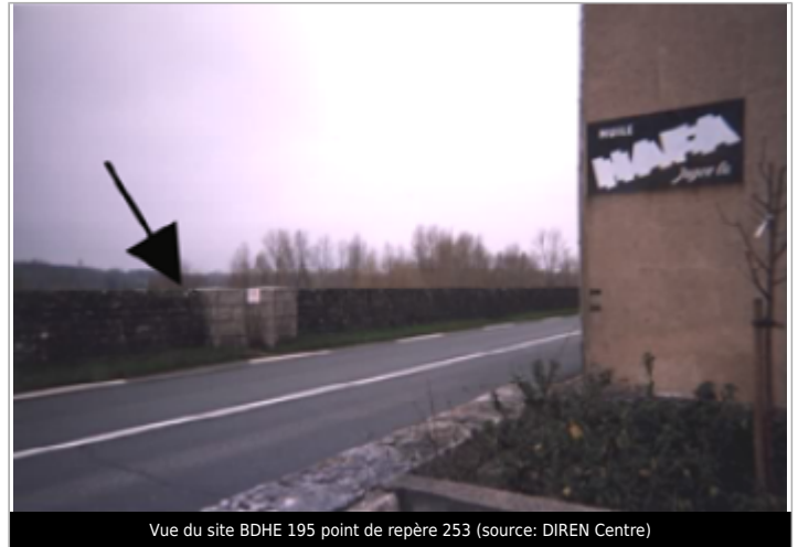
Vue du site BDHE 195 point de repère 253