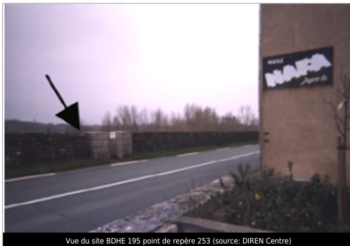
Vue du site BDHE 195 point de repère 253