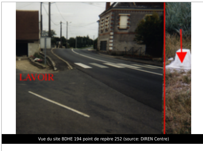
Vue du site BDHE 194 point de repère 252