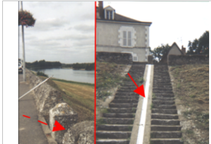
Vue du site BDHE 193 point de repère 251

Coordonnées WGS84 : X: 1.17998697 / Y: 47.47974410