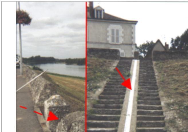
Vue du site BDHE 193 point de repère 251

Coordonnées WGS84 : X: 1.17998697 / Y: 47.47974410