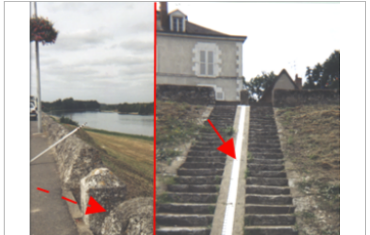
Vue du site BDHE 193 point de repère 251

Coordonnées WGS84 : X: 1.17998697 / Y: 47.47974410