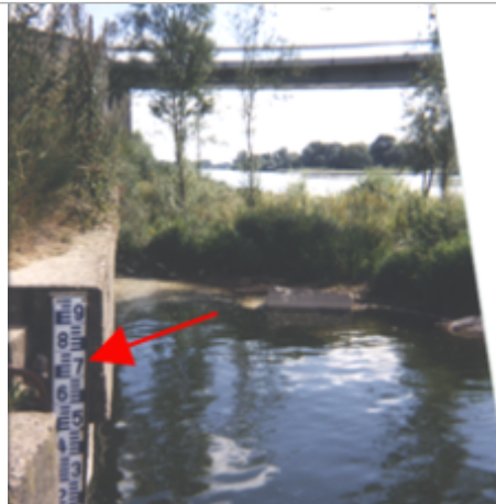
Vue du site BDHE 192 point de repère 250 (source: DIREN Centre)