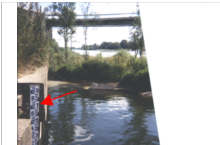
Vue du site BDHE 192 point de repère 250