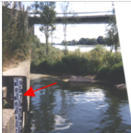
Vue du site BDHE 192 point de repère 250

Coordonnées WGS84 : X: 1.18904337 / Y: 47.48646720