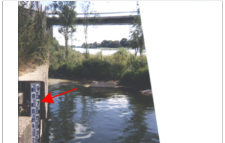
Vue du site BDHE 192 point de repère 250

Coordonnées WGS84 : X: 1.18904337 / Y: 47.48646720